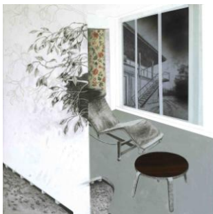
Le Gymnase - 2010

Elle expose à Pékin en 2006, puis obtient le diplôme national d'arts plastiques à l'École nationale supérieure des Beaux-Arts de Paris en 2007.